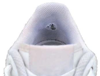
Keine Seltenheit: Ein Loch im Futter der Ferse.