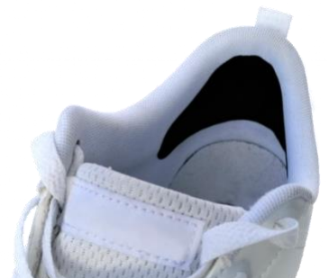
Faltenfrei und dauerhaft repariert mit dem Fersenschutz von Trainer Armour.